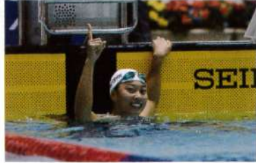
第88回日本学生選手権の100m平泳ぎで4連覇を達成したときのゴールシーン。