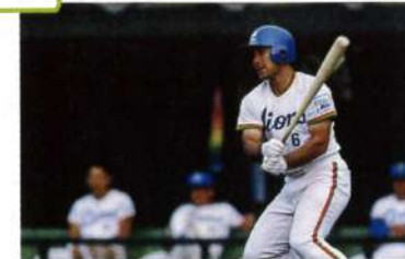
現役時代の背番号は6。名ショートストップとして、ライオンズの黄金時代に活躍した。