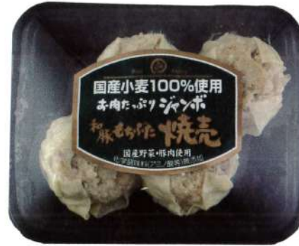
発売以来、常に売上ベスト10に入っているほどおいしさが評判。もちろん国産小麦100%使用。