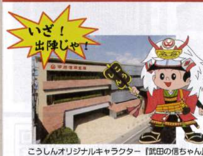
こうしんオリジナルキャラクター『武田の信ちゃん』

目標はもう一度日本一になることです。日々の練習の積み重ねが、試合の結果につながると考えているので、毎日の練習、その中の1本のシュートやパス、足のステップなど、すべてにおいて常に意識してやるように伝えています。また、ハンドボールを通して社会で活躍できる人材育成を目指しています。