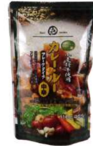
グルテンフリーのカレールーは、おいしくて腸にやさしく、胃もたれしない。